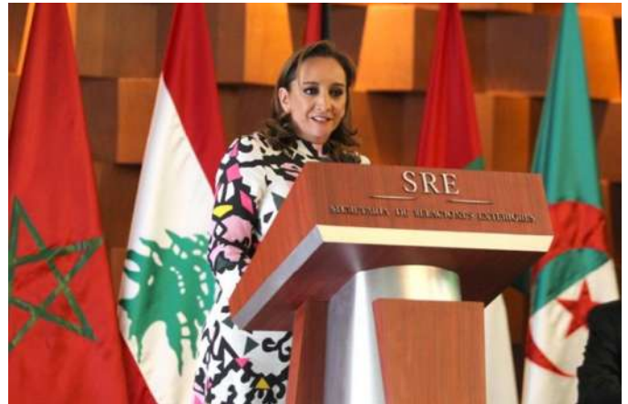
Claudia Ruiz, Massieu, secretaria de Relaciones Exteriores.